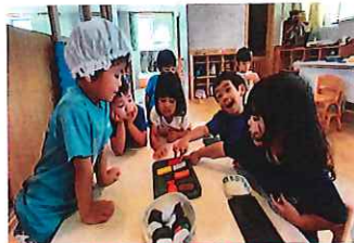
チューリップ組(3歳児)